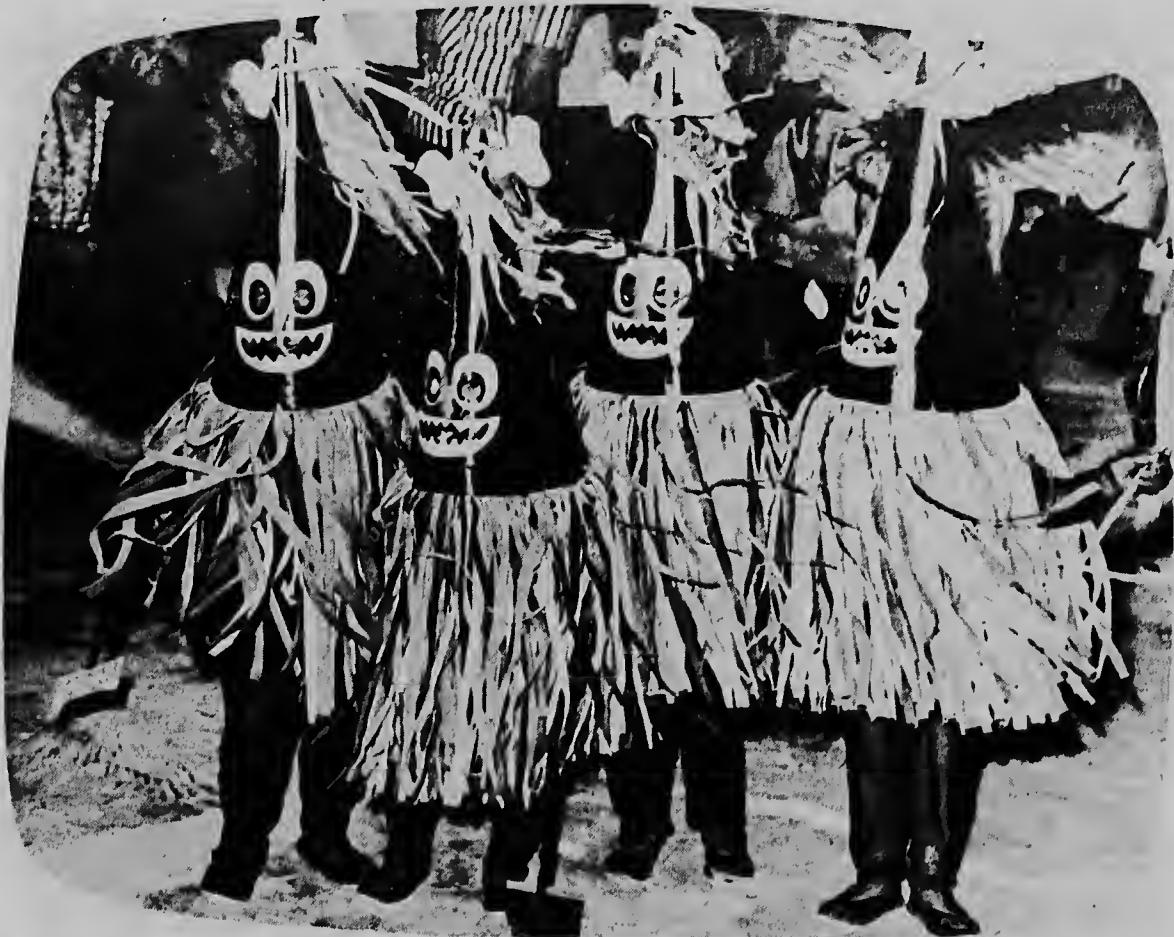
E foto aki ta muestra un cuarteto cu a hala hopi atencion durante celebracion di e fiesta di carnaval infantil den Clubhuis di S.C.A. na Paradera.

Gran baratillo di inventario. Tela di bon calidad, nunca visto, na prijsnan rebahá. Tambe nos a haya tela nobo, cu a worde rebahá. Tela pa cortina y pa furo for di Holanda, den colornan liso.